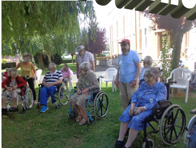
Le 11,13 et 20 juillet, et le 19 août dans les jardins devant la maison de retraite.